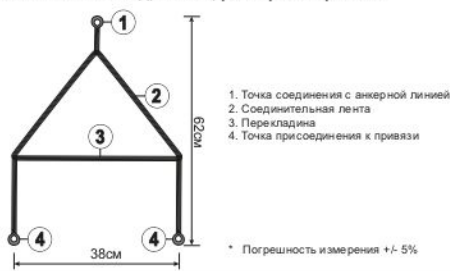
Рис. 3. Совместимое оборудование